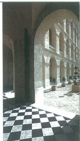
Christophe Duguet pour l'Agence Nuel

et escaliers monumentaux du bâtiment principal bénéficient d'une inscription à l'inventaire supplémentaire des monuments historiques. La nouvelle architecture a été confiée aux cabinets AAA Béchu et Tangram Architectes, la décoration des 172 chambres et 22 suites avec vue sur le Vieux-Port ou Notre-Dame-de-la-Garde est signée Jean-Philippe Nuel.